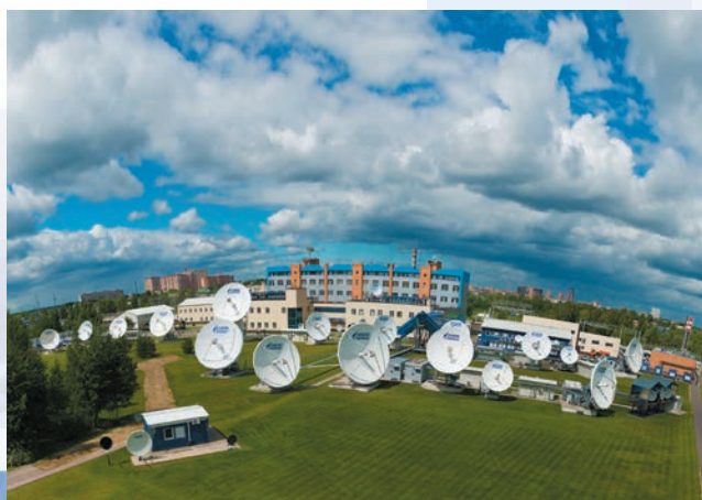
Телекоммуникационный центр в Щелково

«Газпром космические системы» помогает решать целый ряд государственных и социальных задач. Мы предоставляем услуги российским государственным структурам, распространяем общенациональные и региональные телеканалы, участвуем в реализации образовательных проектов. Деятельность «Газпром космические системы» играет значительную роль в сохранении единого информационного пространства страны. Содействовать созданию населению равных условий для доступа к информационным ресурсам, улучшению жизни общества и гармоничному развитию личности – еще одна миссия компании. Удаленность от центров информации и телеком-