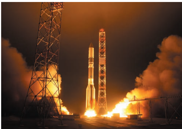
Запуск спутника «Ямал-401» (2014 г.)

Мы хотим выразить благодарность нашему главному акционеру за доверие, поддержку, внимание к нуждам компании и содействие в работе. Постараемся оправдать ожидания.