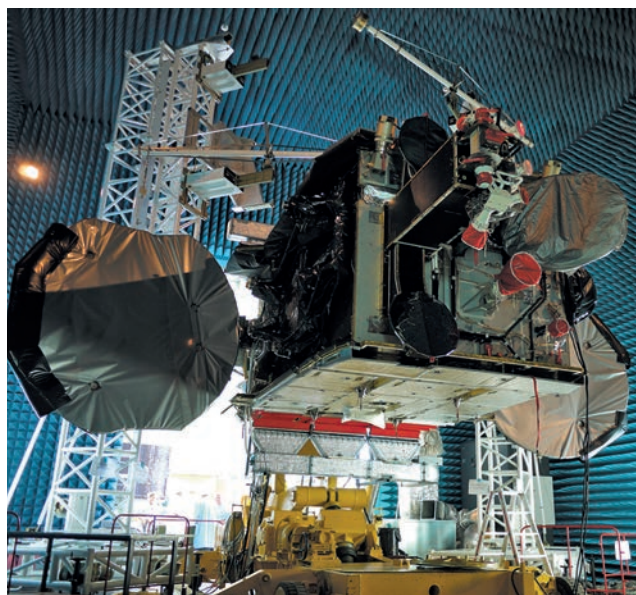
Наземные испытания спутника «Ямал-300К» (2012 г.)

«Газпром» все активнее использует возможности, предоставляемые космическими системами, в своем ключевом бизнесе. Наша компания оказывает спутниковые телекоммуникационные услуги 38 дочерним предприятиям «Газпрома». В их интересах работает сеть более чем из 450 земных станций спутниковой связи. Растущие технологические потребности «Газпрома»